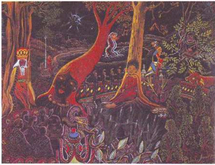
Vision Chamanique extraite de l'ouvrage AyahuascaVisions